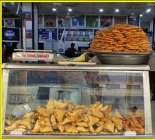
Un organise Market