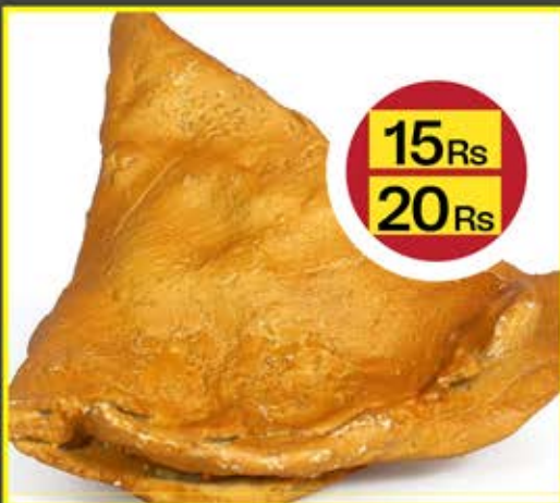
Not Affordable Prices For Common Man