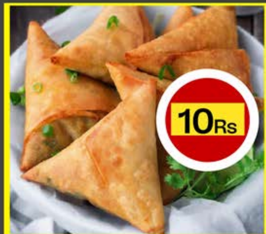
Common Man Affordable Prices Samosa