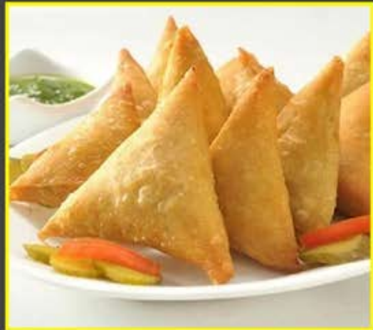
Well Hygiene Maintain